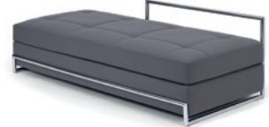
DAY BED 1925