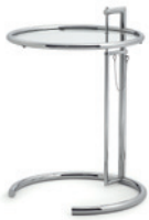
Chrom, Kristallglas Chrome, crystal glass

Estructura regulable en altura de tubo de acero cromado o con recubrimiento en polvo negro. Tablero de cristal claro, gris parsol o de metal lacado en negro. Para más detalles y colores, ver lista de precios.