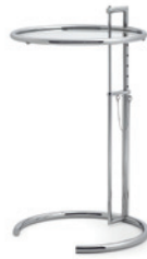
Chrom, Kristallglas Chrome, crystal glass