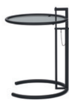
Schwarz, Parsolglas Black, smoked glass