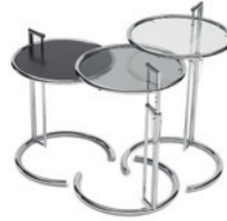
Chrom, Metall schwarz, Parsolglas, Kristallglas Chrome, black metal, smoked glass, crystal glass