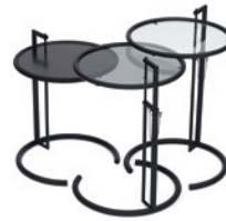
Schwarz, Metall schwarz, Parsolglas, Kristallglas Black, black metal, smoked glass, crystal glass