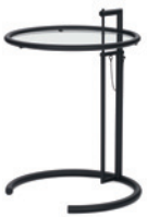
Schwarz, Kristallglas Black, crystal glass